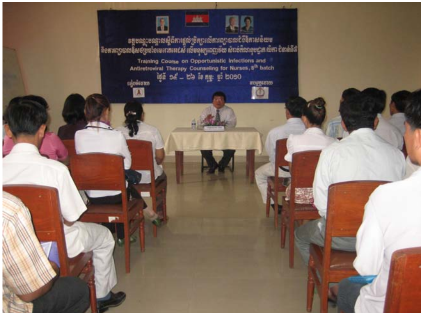
Training Course on Opportunistic Infections and Antiretroviral Therapy Counseling for Nurses, 8 th batch

វគ្គបណ្តុះបណ្តាលស្តីពីការផ្តល់ប្រឹក្សាលើការព្យាបាលជំងឺឱកាសនិយម និង ការព្យាបាលឱសថប្រឆាំងមេរោគអេដស៍ លើមនុស្សពេញវ័យ សំរាប់គិលានុជ្ជាគ្រូ យីកា ជំនាន់ទី ៨