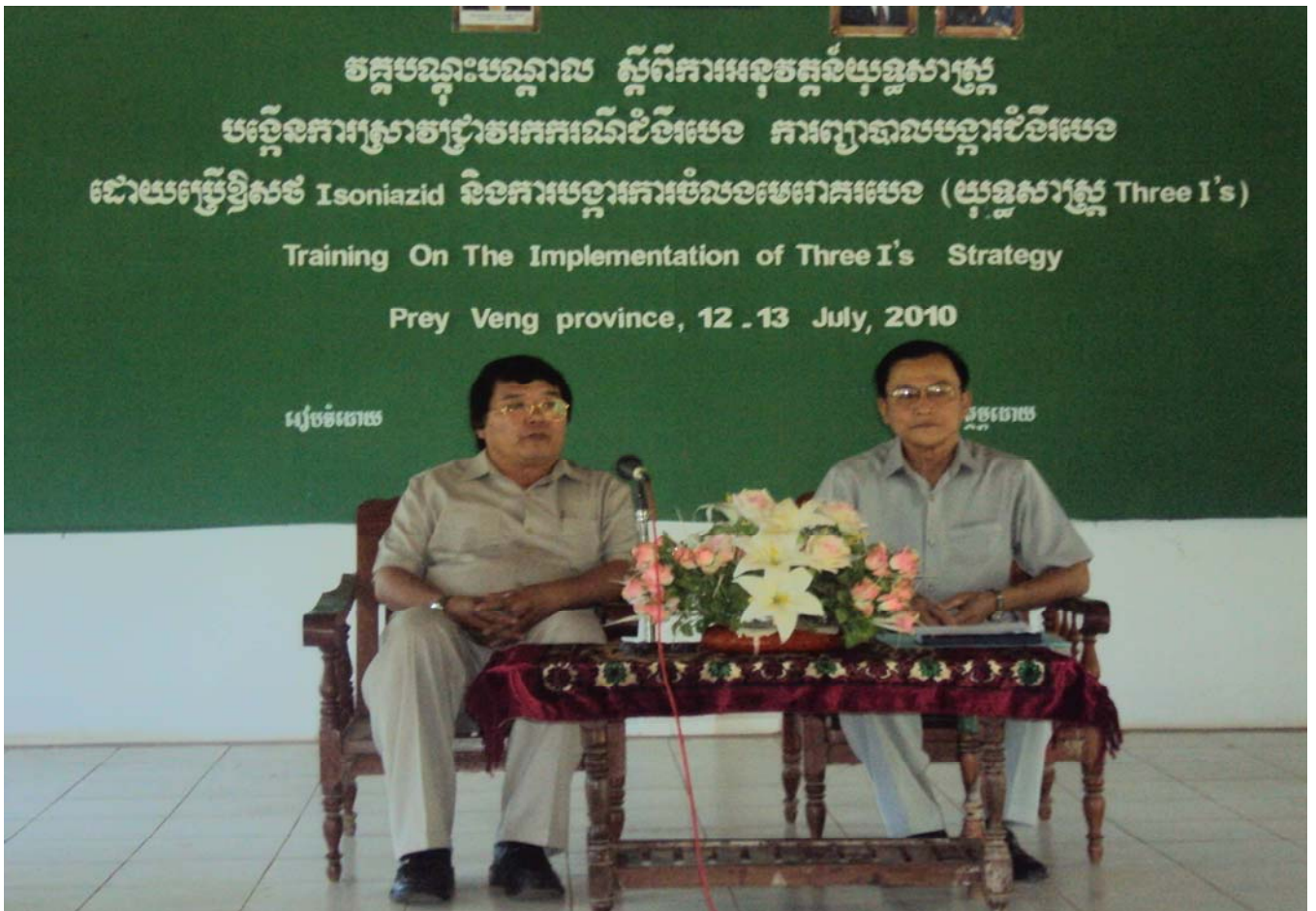
PHD, Prey Veng 12 - 13 July 2010